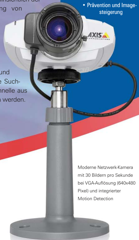
Moderne Netzwerk-Kamera mit 30 Bildern pro Sekunde bei VGA-Auflösung (640x480 Pixel) und integrierter Motion Detection

2004 Das Marktforschungsinstitut IMS Research prognostiziert der Netzwerk-Kamera-Technologie bei CCTV-Überwachungsaufgaben allein in Europa mehr als eine Verdreifachung des Umsatzes von 22 Millionen Euro in 2002 auf 75 Millionen Euro im Jahr 2008.